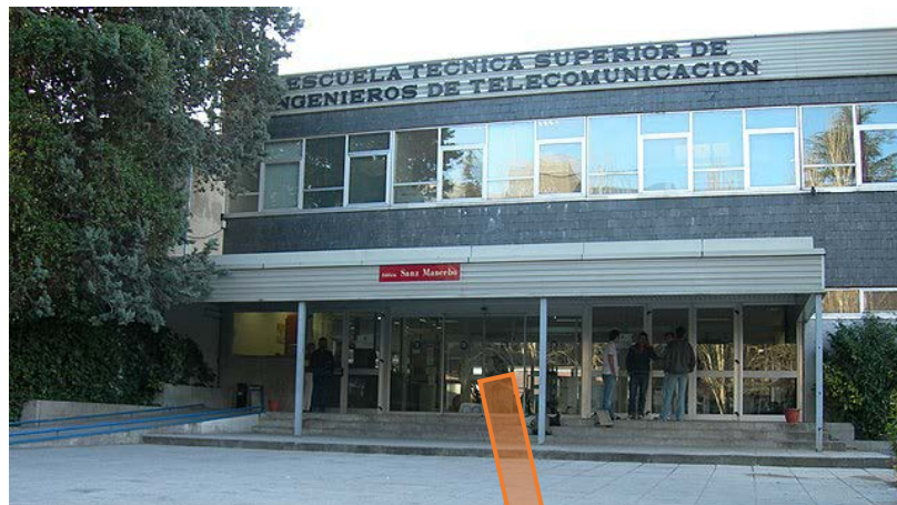
Figura 1. ETSI. de Telecomunicación UPM (Edif. A)

Línea 6, <Circular> estación Ciudad Universitaria .