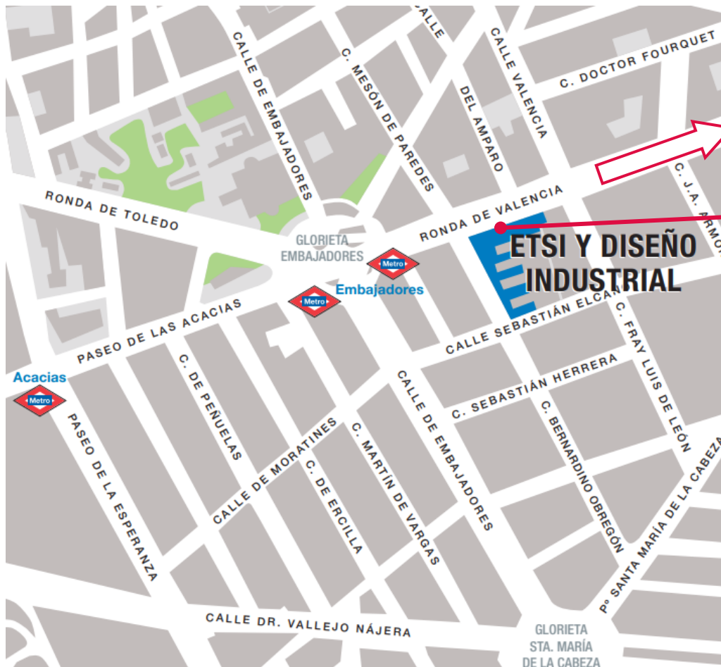
Figura 1. Situación del edificio y entrada de la ETSIDI.

Línea C1, C2, C3, C4, C5, C6, C7, C8, C10 estación de Atocha .